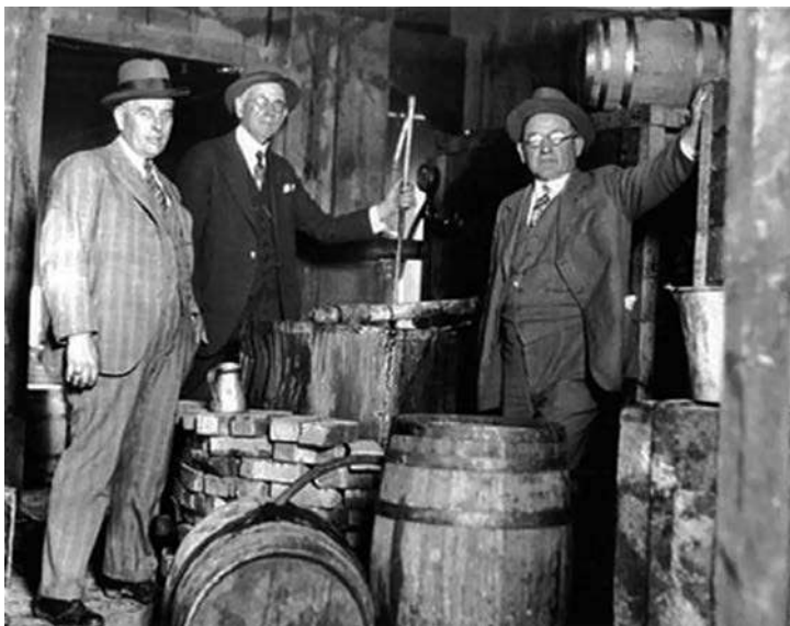
PROHIBICIJA: Izvor prihoda koji se nije mogao zaobići

nisu dovoljno dugo živeli da to shvate. Novi „bosovi“ nisu dozvoljavali da im neko uznemirava proizvođače, i vrlo brzo je klasični reket bespomoćnih malih biznismena prestao da postoji. Crna ruka više nikog nije plašila, a reket će se ponovo pojaviti pedesetih godina, ali u krajnje rafiniranoj varijanti.