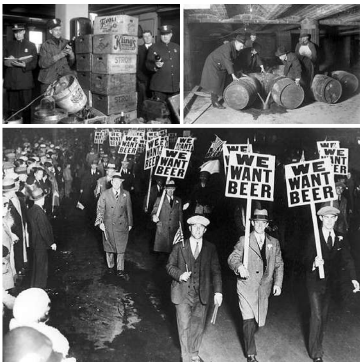
PROHIBICIJA: Plodno tlo za korene organizovanog kriminala

na njihovu teritoriju, morale su da traže saglasnost. Ako neka mafijaška organizacija želi da likvidira neposlušnog člana koji je pobjegao na teritoriju druge mafijaške organizacije, onda ga neće lično proganjati, jer bi to bilo ozbiljno kršenje teritorijalnih prava druge organizacije. Umesto toga zamoliće tu organizaciju da ubije člana koji je osuđen na smrt i koji se nalazi sada na teritoriji organizacije zamoljene da izvrši kaznu. Ona ima obavezu da taj zahtev izvrši, bez posebnog plaćanja ili zahvaljivanja, jer će jednog dana ona biti u situaciji da takvu uslugu traži od druge organizacije.