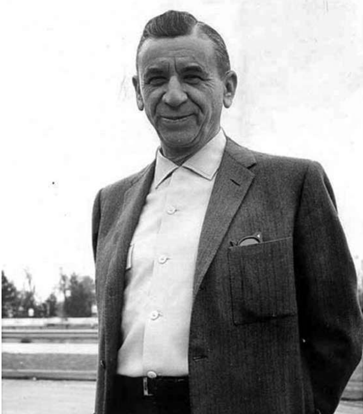
NAJVEĆI JEVREJSKI GANGSTER: Mejer Lenski

Odakle ime Cosa nostra („Naša stvar“)? Ime naravno nije izmislio Valači. Ono jeste sinonim za mafiju, ali je to više akademsko pitanje za one koji nisu članovi. Za članove, koji za sebe nikada neće reći da su mafijaši, bio je potreban izraz u međusobnoj komunikaciji koji neće razumeti oni koji nisu članovi ili FBI ako prisluškuje razgovore. Izraz je nastao u Americi i tipičan je za novu američku mafiju, ali u njegovom nastajanju ulogu ima i najveći jevrejski gangster Mejer