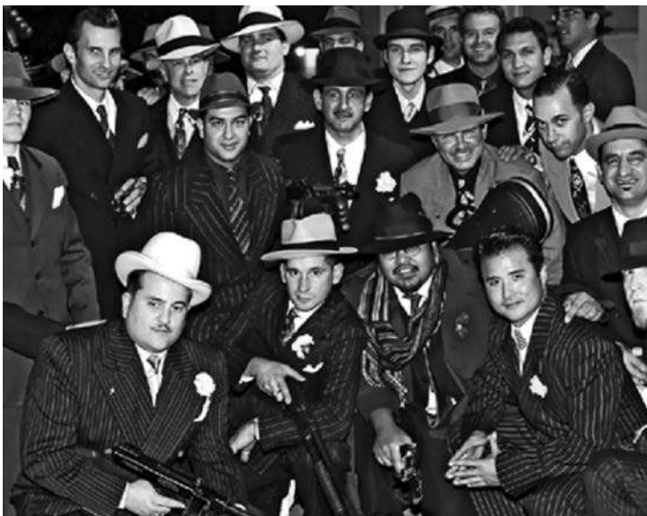
KRIMINAL KAO NAČIN ŽIVOTA: „Vojnici“, „poručnici“ i „kapetani“

tumačenja i primene nema nikakve dileme. Nema opravdanja za greške, potkradanje porodice, „poslove sa strane“ za koje porodica ne zna, ugrožavanje sigurnosti porodice na bilo koji način, da ne govorimo o saradnji sa zakonom. Kazna je uvek smrt, sprovodi se iznenada tako da grešnik nema šanse da se izvuče i to služi kao primer ostalima, uz jasan stav da je reč o „nečasnoj“ delatnosti člana koji je uprljao ne samo svoj obraz već i ugled cele porodice.