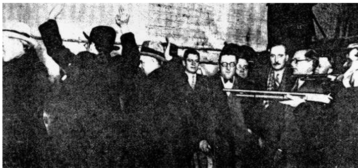
FILMSKA SCENA: Američka mafija

Struktura mafije kao društva kriminalaca bitno se razlikuje na Siciliji, ili u Italiji, od one u Americi, što je i logično budući da se prilike u ove dve zemlje razlikuju kao nebo i zemlja, po svim pitanjima. Na Siciliji, starim mafijašima je bila važnija „čast“ od novca, važnije su bile stare vendete nego posao. Kod mafijaša u Americi, pogotovo onih koji su tamo rođeni, novac je bio krajnji i jedini cilj. Stari mafijaši, koji su u drugoj polovini 19. veka, sa doseljnjem u Ameriku, doneli i strukturu organizacije iz starog kraja, i bili posprдно nazivani „onima koji suču brkove“, i koje je sa scene počistio Laki Lučano likvidiravši stare, velike mafijaše Džoa Maseriju zvanog Šef i Salvatorea Marancana, držali su se „etničkog kriminala“, tražeći žrtve među svojim zemljacima, kao da su još uvek na Siciliji, dok su američki mafijaši izašli iz okvira etničkog kriminala, izašli iz geta i razvili kriminalne aktivnosti